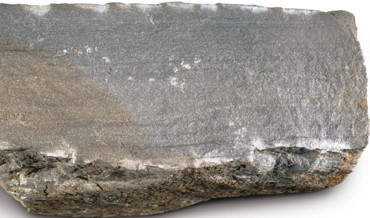
Breuksteen (sch. 1:1)