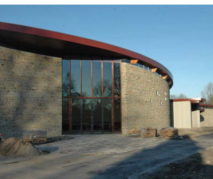
Breukstenen half behouwen