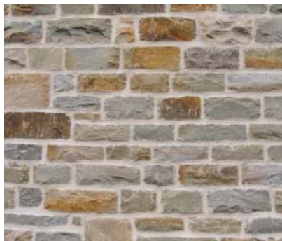
Breukstenen Haaks gekapt